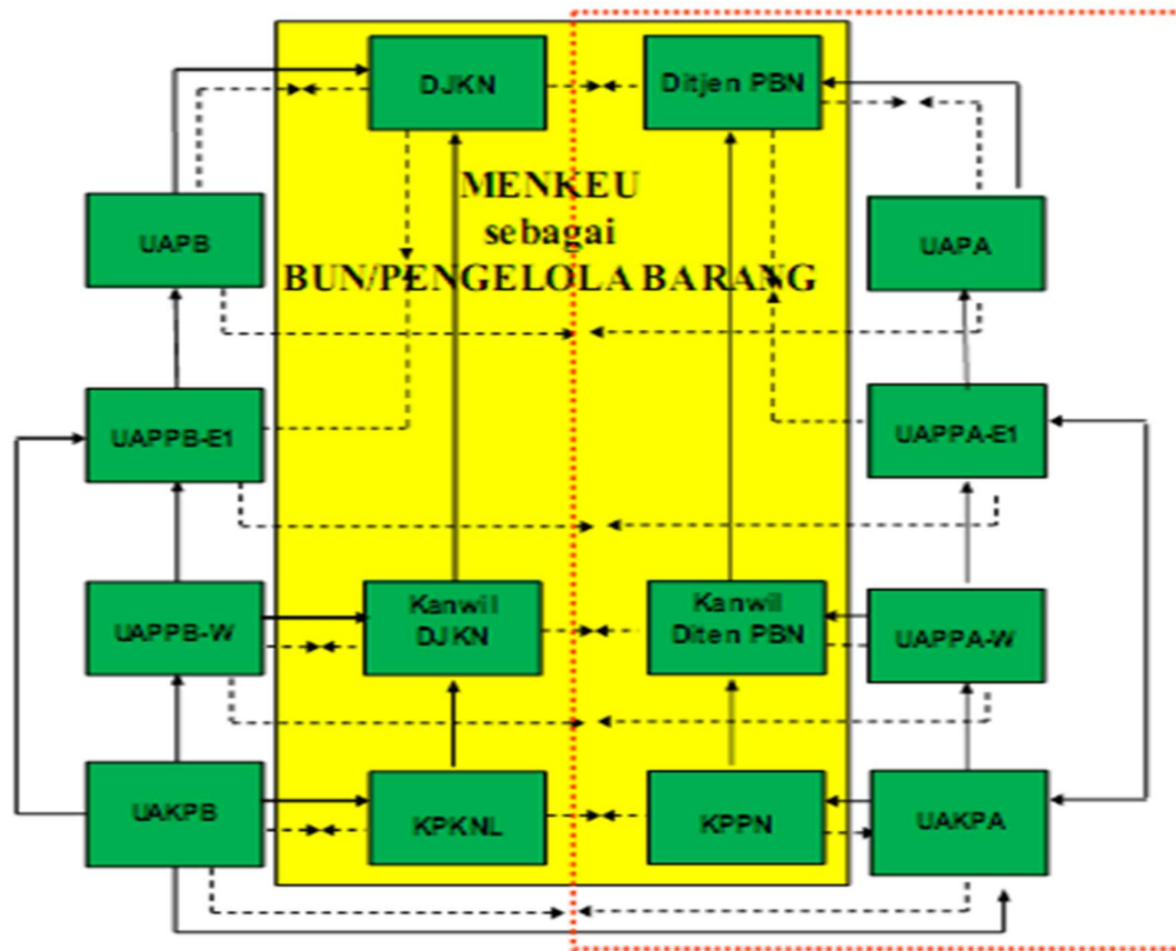
Gambar 2. Diagram Rekonsiliasi Barang Milik Negara